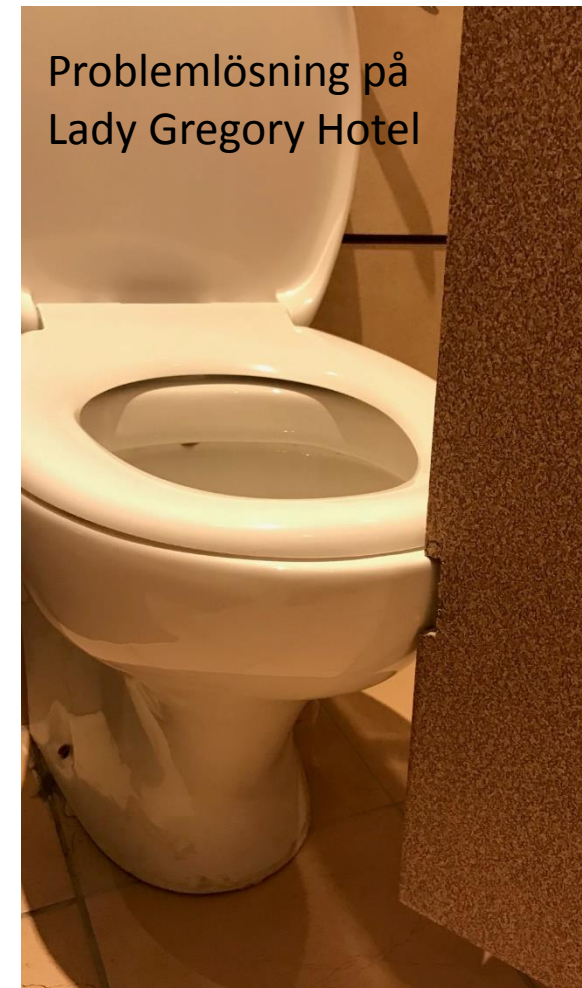
Problemlösning på Lady Gregory Hotel