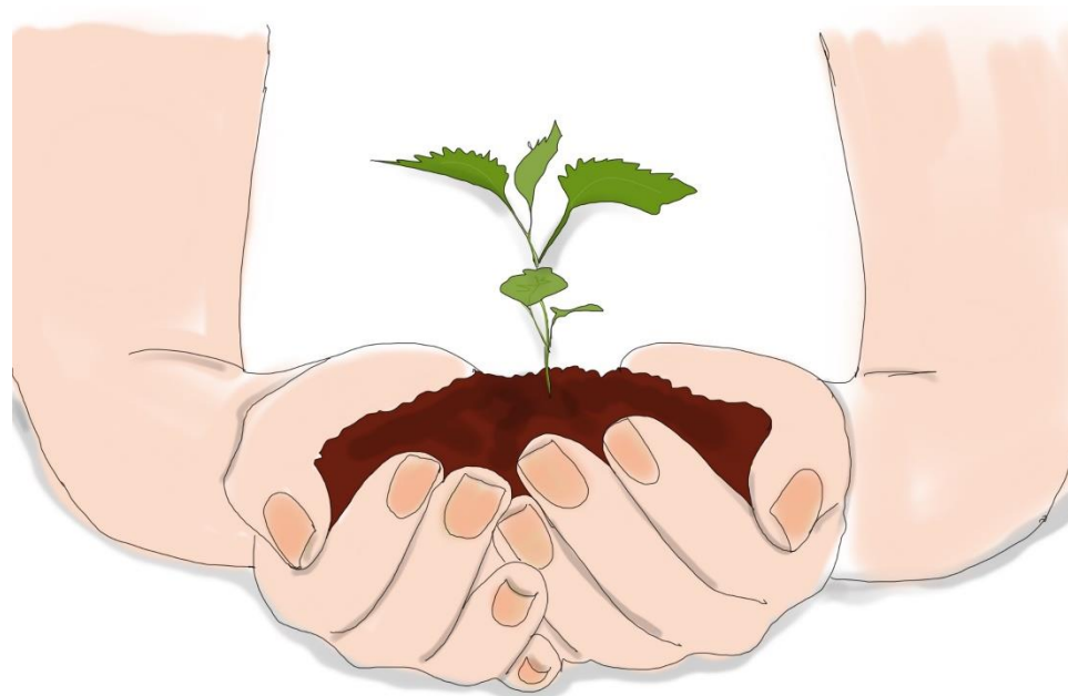
Illustration: Sofia Magnusson

De processer, tankar, samarbeten och metoder som HNV Link projektet och Innovationsresan lyft fram visar att samverkan över organisationsgränser med kompetens- och lösningsfokus skapar förutsättningar för hållbar landsbygdsutveckling och landsbygdsföretagande, med höga naturvärden i fokus, inom alla gröna näringar.